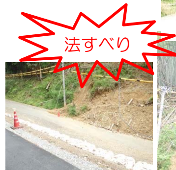
福知山市：土砂災害対策事業