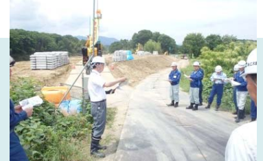
福知山出張所による工事説明

参加者意見： ・出水時の流木問題について、市としてもできる対応があると考え。各管理者でできることを対応していく必要がある（福知山市副市長） ・築堤や掘削に伴う流況変化の可能性について説明を受けたため、注視していきたい。団員にも情報共有を図りたい。（福知山市消防団副団長）