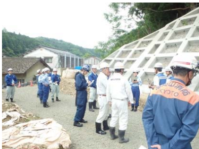
京都府：急傾斜地崩壊対策事業