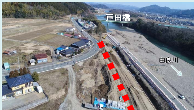
■ ■ ■：築堤予定箇所