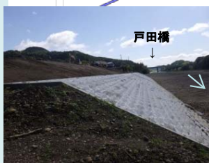
低水護岸施行状況