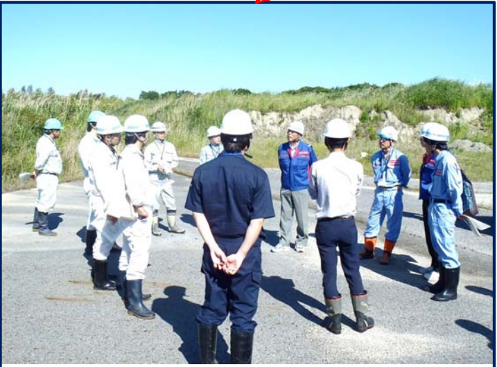
6.2 k 付近にて重要水防箇所や防災備蓄ヤードを合同で点検し意見交換を行った