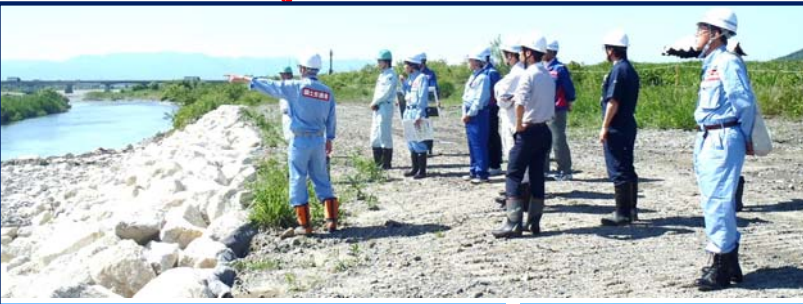
11.2 k 付近にて低水護岸復旧状況、重要水防箇所説明