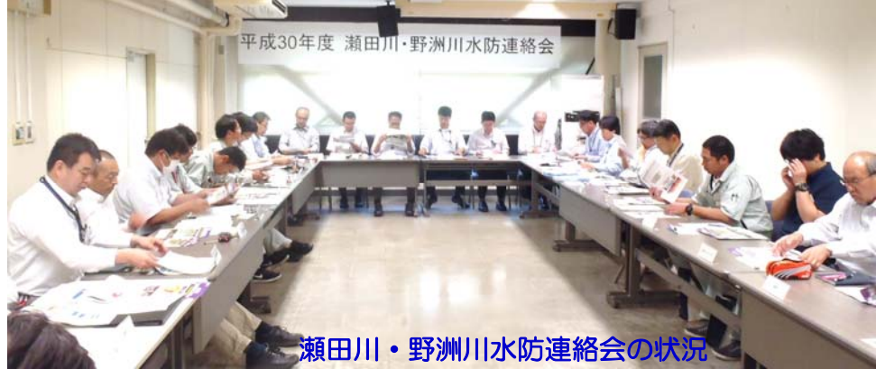
瀬田川・野洲川水防連絡会の状況