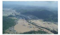
Overview of the Typhoon No.18 of September 2013