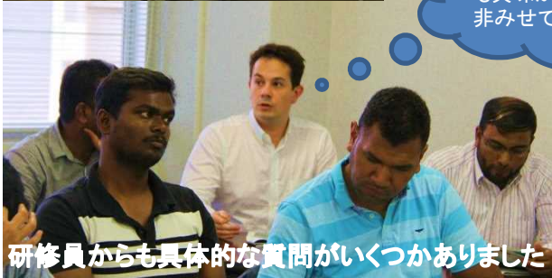
研修員からも具体的な質問がいくつかありました