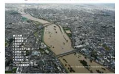
平成25年9月台風18号洪水の概要 「Overview of the Typhoon No.18 of September 2013」