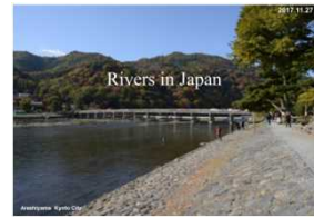
「Rivers in Japan」日本の河川