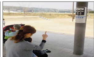
公園の休憩所に設置した まるまちHM