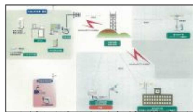
同報系防災行政無線 構成図