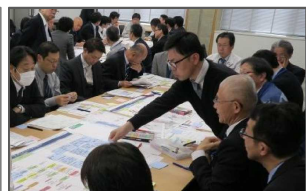
グループワークによる多機関連 携型タイムライン作成