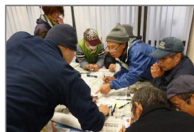
河川レンジャーの支援による マイ防災マップ作成