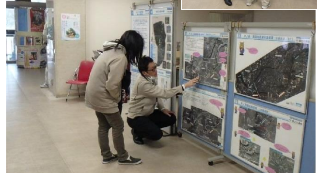
尼崎市役所1階ロビーで説明を実施しました(3月22日)。