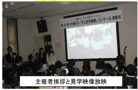
主催者挨拶と見学映像放映