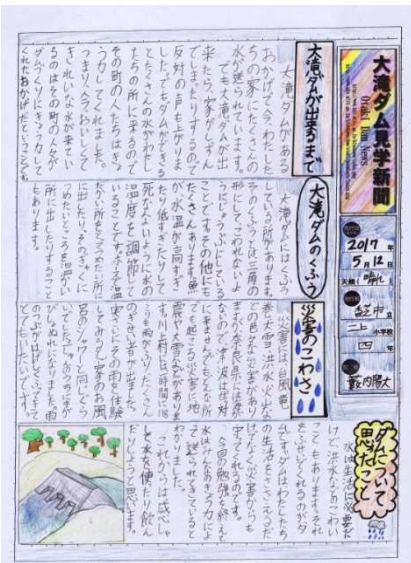
審査委員の選評 段落を意識し、丁寧な字でしっかり書いてあり、読みやすいです。