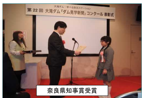
奈良県知事賞受賞