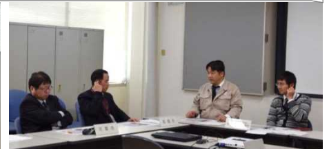
河川管理者と市担当による議論