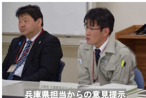
兵庫県担当からの意見提示