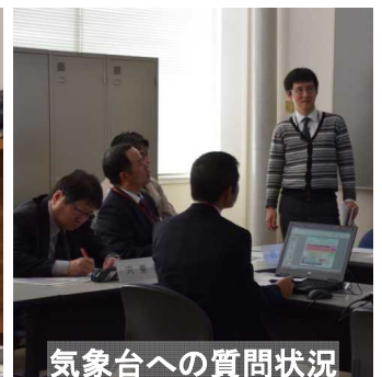
気象台への質問状況