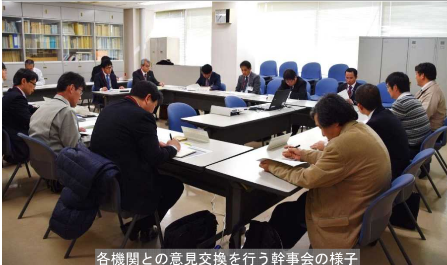
各機関との意見交換を行う幹事会の様子

また、減災対策協議会の取組状況について意見交換を行い、L2洪水に対応したハザードマップ作成において記載する情報や避難場所の確保等に関する課題などについて活発な議論が交わされた他、神戸地方気象台による防災気象状況の講習や姫路河川国道事務所による浸水リスク提供についての説明などを行い、参加者の防災意識向上に取り組みました。