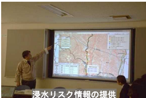
浸水リスク情報の提供