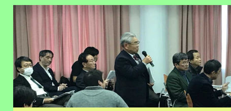
特定非営利活動法人 きらめき紀の川