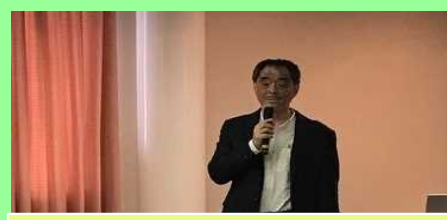
琵琶湖・淀川流域圏連携交流会