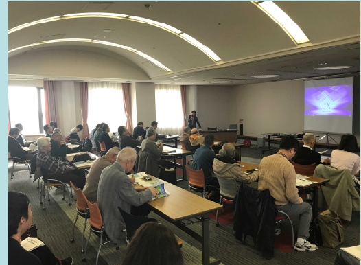
近畿管内4水系の7団体が参加