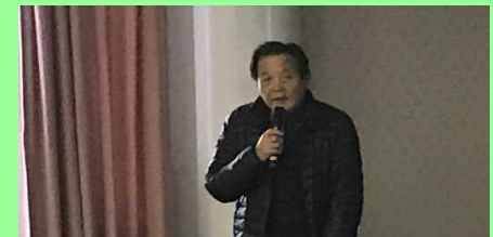
ねやがわ水辺クラブ