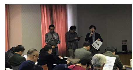
近畿地方整備局からの情報提供 (近畿地方整備局 河川部)