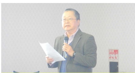
全国協議会からの情報提供 (河川協力団体全国協議会 山道代表)