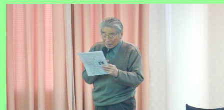
大和川市民ネットワーク