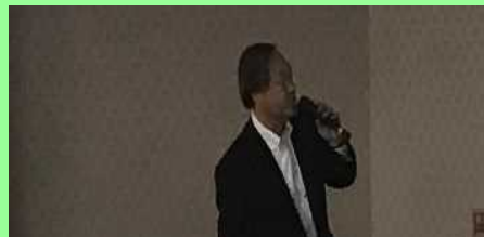
特定非営利活動法人 瀬田川リバブレ隊