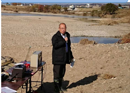
東出所長による挨拶の様子