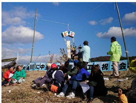
くす玉を割り みんなで祝福