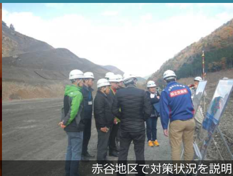
赤谷地区で対策状況を説明