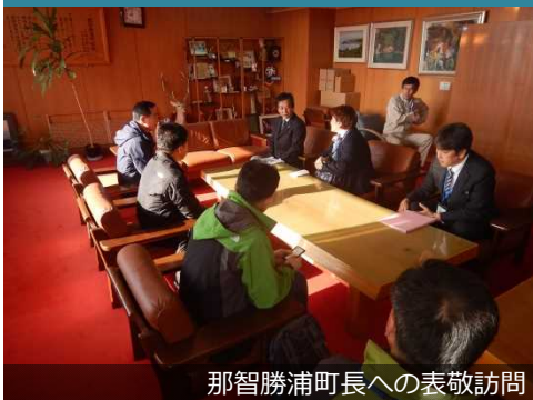
那智勝浦町長への表敬訪問