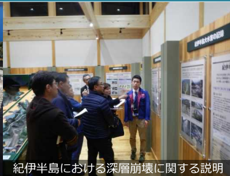
紀伊半島における深層崩壊に関する説明