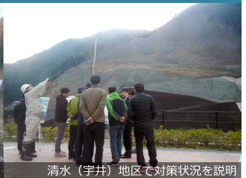
清水(宇井)地区で対策状況を説明