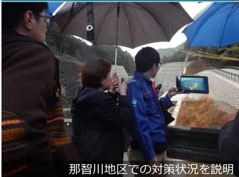
那智川地区での対策状況を説明