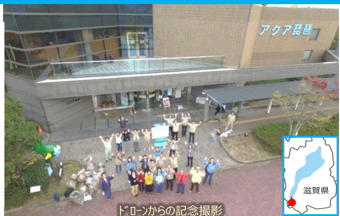
ドローンからの記念撮影