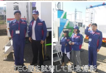
TEC服を試着して記念撮影