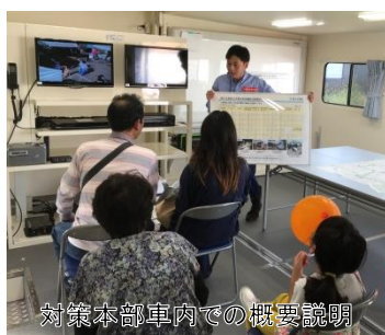
対策本部車内での概要説明