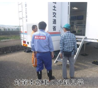
対策本部車の外観見学

対策本部車を外から見るだけでなく、車中へ入っていただき活動状況や設備について説明を行いました。 また、その他の災害対策車も合わせて説明しました。