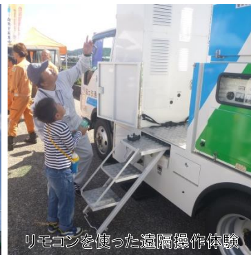
リモコンを使った遠隔操作体験