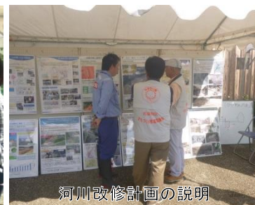
河川改修計画の説明