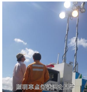
照明車点灯状況を見学