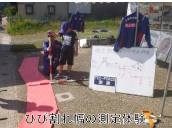
ひび割れ幅の測定体験

地震による道路のひび割れを想定して、TEC-FORCEの被災調査の体験をしていただきました。 また、希望者にはTEC-FORCE服の貸出しを行いました。