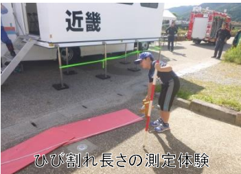
ひび割れ長さの測定体験