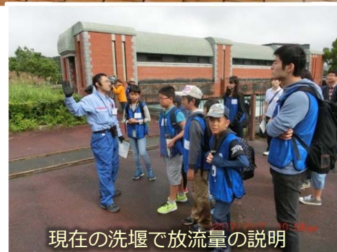
現在の洗堰で放流量の説明