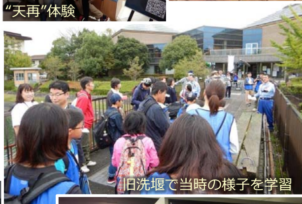
旧洗堰で当時の様子を学習