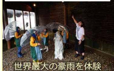
世界最大の豪雨を体験