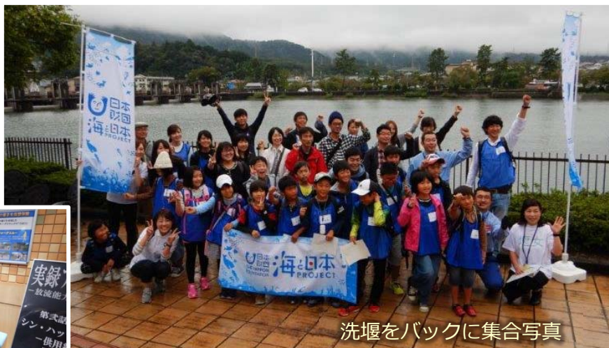
洗堰をバックに集合写真