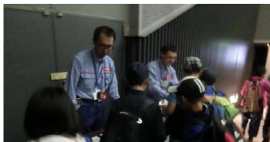
「ピズ検定」問題配布 ※ アクア琵琶を巡って問題を解き、全問正解で認定されます