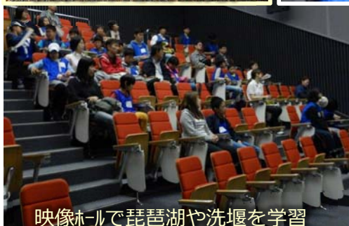
映像ホールで琵琶湖や洗堰を学習