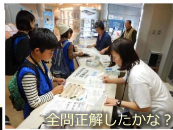
全問正解したかな？