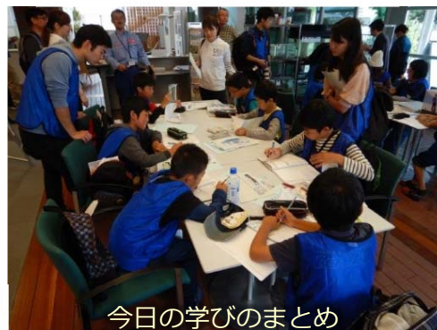
今日の学びのまとめ