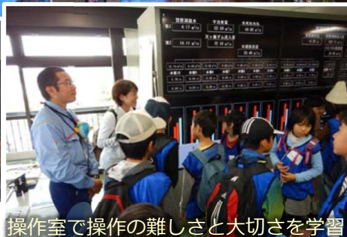
操作室で操作の難しさと大切さを学習