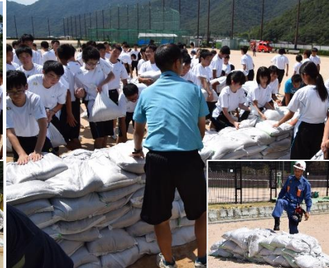
土のう積み工の説明・体験