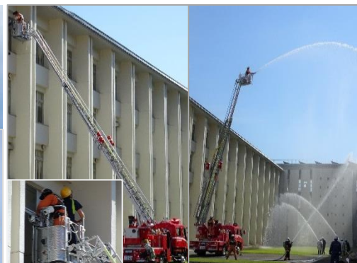
高所救助訓練・消火訓練