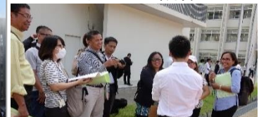
SEEDS Asia(フィリピン)による視察