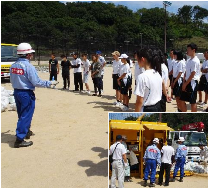
土のう造成機の説明・体験