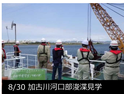
8/30 加古川河口部浚渫見学