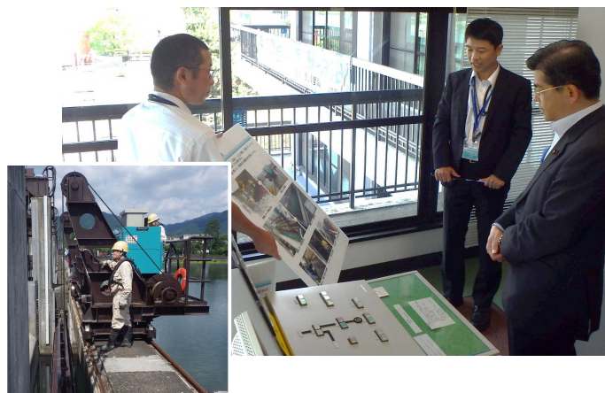
瀬田川洗堰点検状況の説明