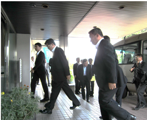
琵琶湖河川事務所 到着