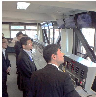
瀬田川洗堰の概要説明