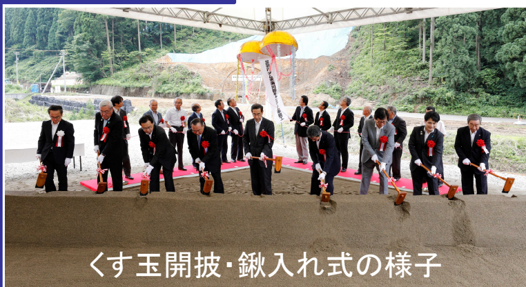
くす玉開披・鍬入れ式の様子