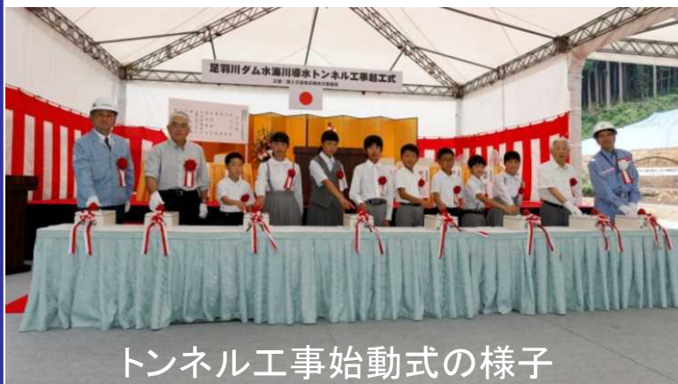
トンネル工事始動式の様子