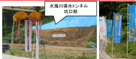
水海川導水トンネル坑口部

【問い合わせ先】 国土交通省 近畿地方整備局 足羽川ダム工事事務所 調査設計課 〒918-8239 福井県福井市成和1-2111 TEL 0776-27-0642