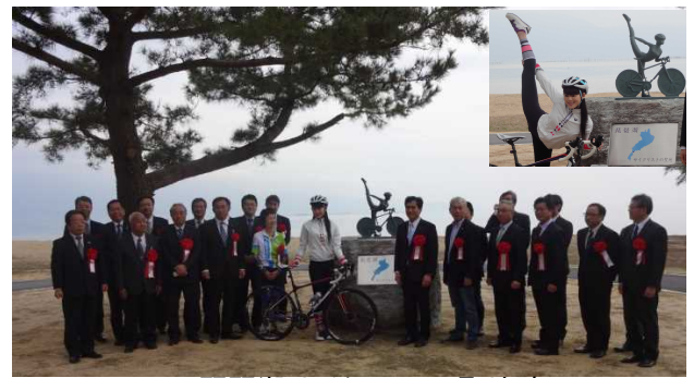
琵琶湖サイクリストの聖地碑