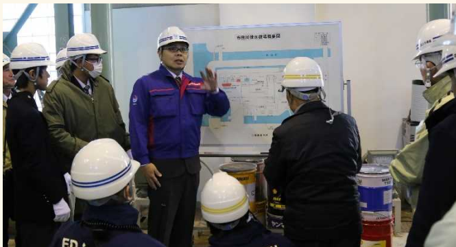
職員による施設の説明