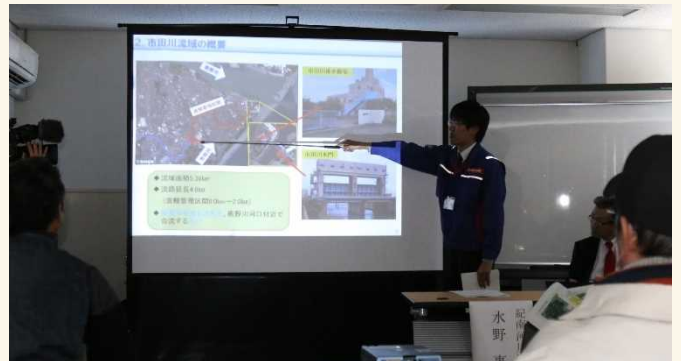
職員による説明を聞く参加者