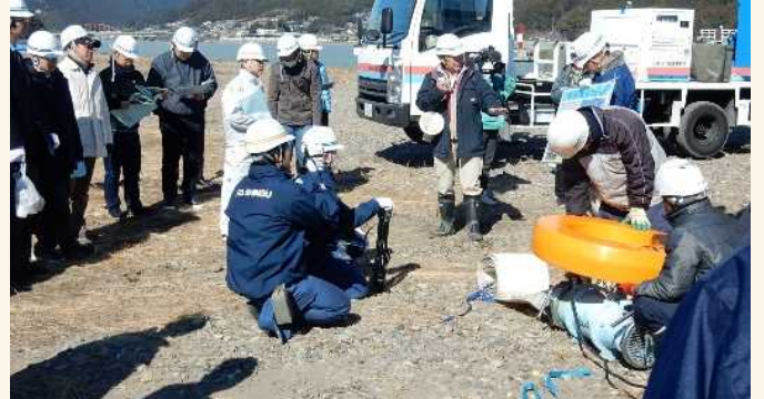
災害対策用機械の説明