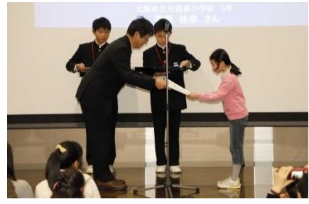
表彰状授与式の様子

●絵の部 大和川河川事務所賞 ●ポスターの部 近畿地方整備局長賞 大和川水環境協議会賞 2016年度の入賞作品(一例)