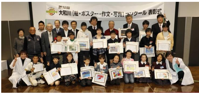
大和川コンクール表彰式の記念撮影

●絵の部 大和川河川事務所賞 ●ポスターの部 近畿地方整備局長賞 大和川水環境協議会賞 2016年度の入賞作品(一例)