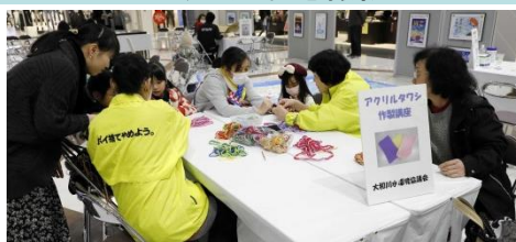
アクリルタワシ作成ブースの様子