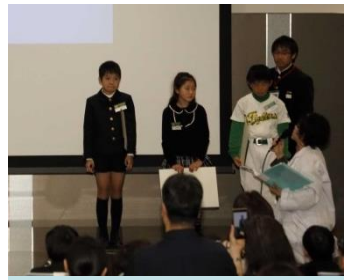
インタビューの様子