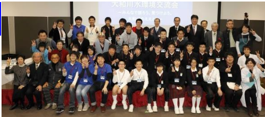
交流会の記念撮影