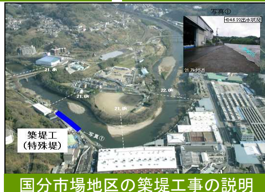
国分市場地区の築堤工事の説明

柏原市では「危機管理型ハード対策」の天端保護の工事が竣工し、「洪水を安全に流すためのハード対策」の国分市場地区の築堤工事を現在施工中です。身近な水防災意識社会再構築ビジョンの工事を紹介をすることで興味をもって聞いていただきました。