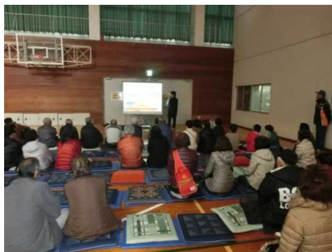
防災訓練(講話)の様子