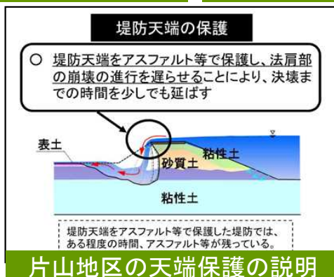
片山地区の天端保護の説明