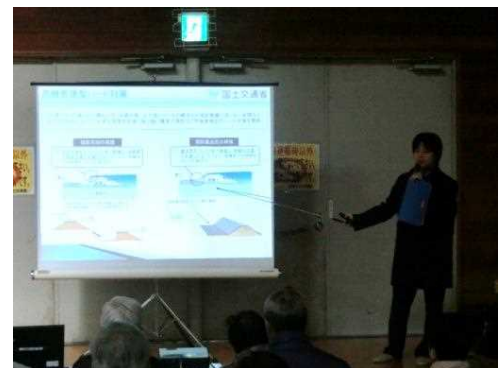
若手職員による説明