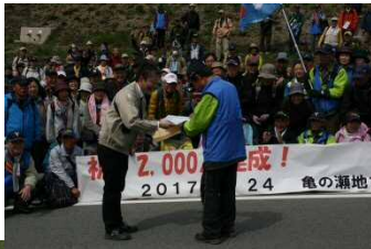
(画像左)2,000人達成の記念賞状 (写真右)見学会に参加された大和ウォーキング協会の会長へ記念賞状授与 (写真下)参加された267名の皆さんと記念写真 (画像右)来場者数の推移状況