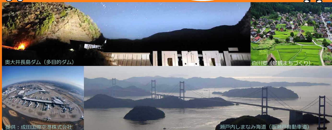
奥大井長島ダム (多目的ダム)