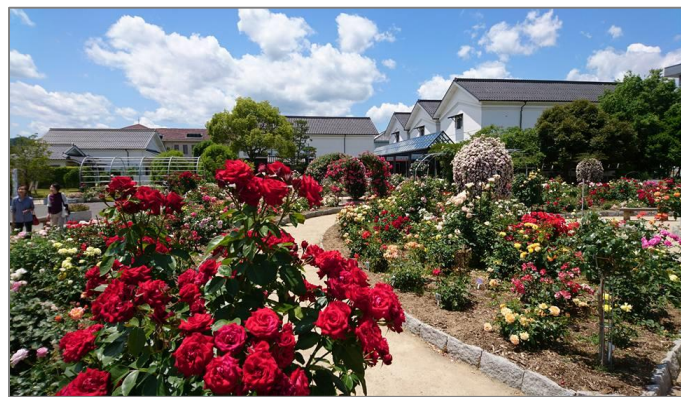
綾部バラ園で咲くバラ