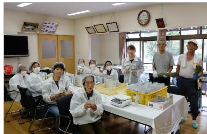
収穫・加工したハーブティーを袋詰め