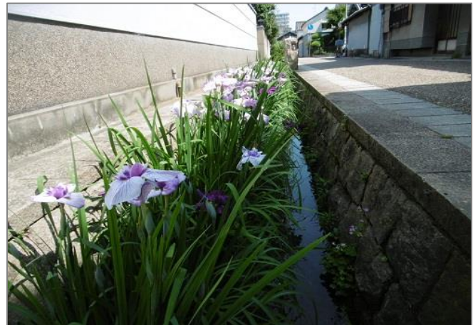
大水路に咲いた花菖蒲