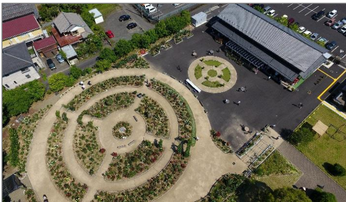
綾部バラ園とあやべ特産館

綾部市制施行60周年記念事業として整備され、平成23年に「綾部バラ園」開園。同年、バラ園を継続して管理運営する「綾部バラ会」が設立されました。登録ボランティアにより除草や花ガラ摘み等を毎週実施する他、春と夏の年2回、バラまつりを開催。現在、120種類・1,200本のバラが咲いており、令和元年春のバラまつりには79,096人の入場者があり、バラ園を軸に綾部市への観光客が増加することで市の活性化に貢献しています。