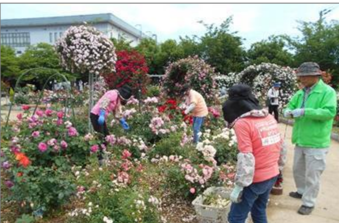
市民ボランティアの剪定作業