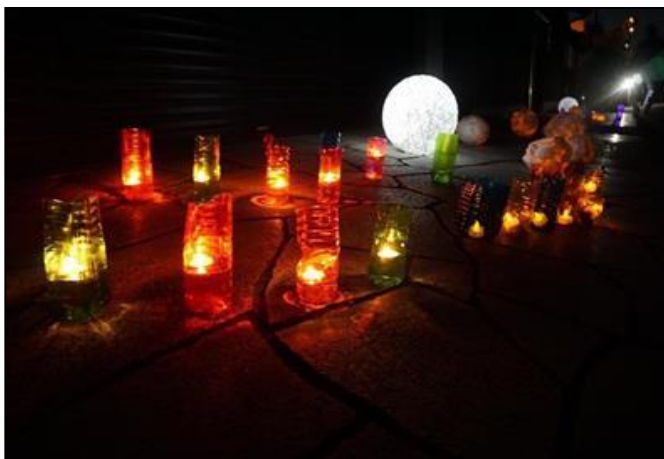
燈路まつりで大水路の橋に並べた燈籠