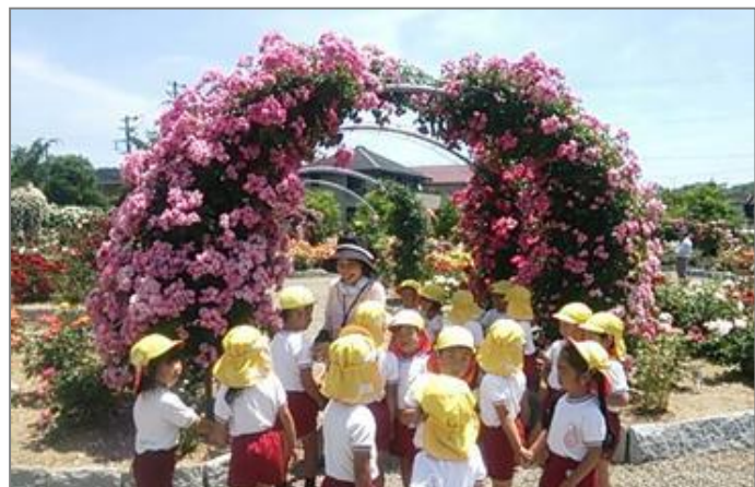
近隣幼稚園の散歩や遠足にも利用