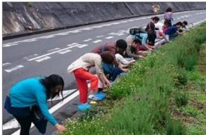
県道沿いに植えたハーブの摘み取り

平原地区は江戸時代から、薬草栽培が盛んな集落でしたが、人口減少・少子高齢化が進み、農業の衰退とともに耕作放棄地が増えていました。そこで、住民一丸となって、もう一度活気のあるむらづくりに取り組むことを決心し、平成25年から県道沿線を中心に耕作放棄地でのハーブや花を植栽。そのハーブの栽培・収穫・加工で耕作放棄地を解消、花等による道路景観の向上、新たな特産品が創出され、平成27年に開店したピザハウスは毎回約160枚のピザが売り切れるほどの来店があり、活気と賑わいの創出など、県道を中心に地域づくりが進んでいます。