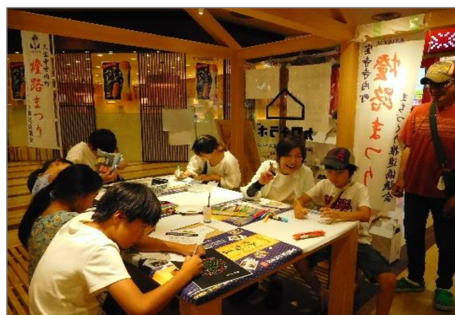
子どもも大人もひとつになって 燈路まつりを準備