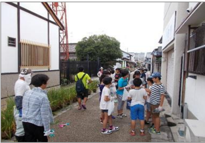
小学生との大水路の掃除

寺内町は歴史資源やまちなみ、大水路、環濠も一部当時のまま残っており、それらの景観など良さを活かした地域づくりを情報発信するため、当該協議会を立ち上げ、燈路まつりを中心に様々な活動を行っています。毎月1回の清掃活動の他、燈路まつりの前には、地元の小・中学生と一緒に道路や環濠、大水路の草引き・清掃を実施。燈路まつりではその道路や大水路にみんなで燈籠の飾り付けを行って町の名所として賑わっています。燈路まつりの規模も年々大きくなり、来場者数は第1回を開催した時に1,000人だったが、第9回の実績は7,000人を超えています。