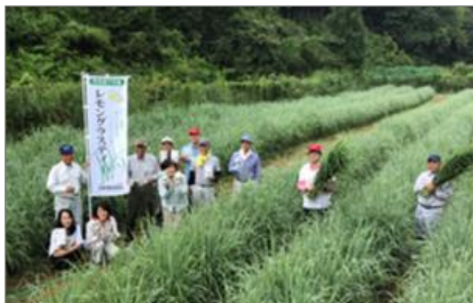
収穫前のレモングラス