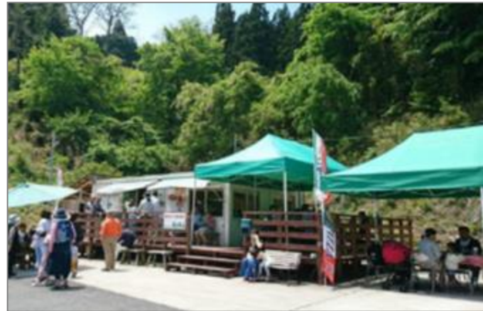
住民参加で建設されたピザハウス