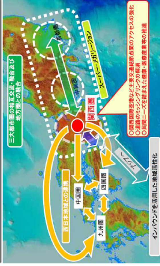
【SMR形成：リニア大阪開業（2045年から最大8年前倒し）以降】