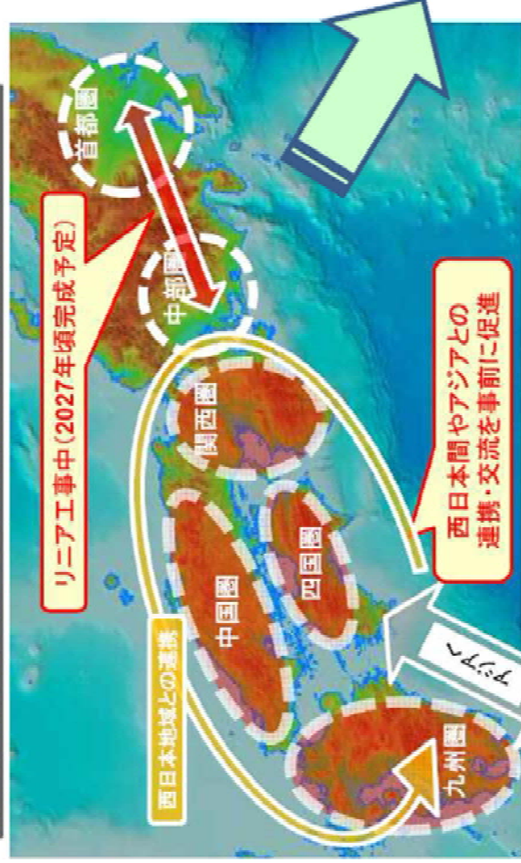
【リニア大阪開業（2045年から最大8年前倒し）までの準備】