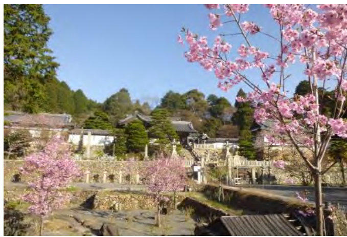
柳谷の門前に植樹した「陽光桜」