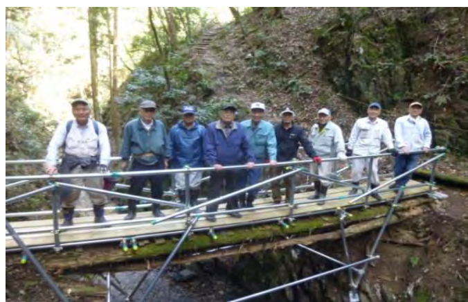
西山古道で杉の丸太橋を手摺付きの パイプ端に架け替え