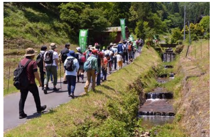
地域資源を活かした地域探訪ツアー