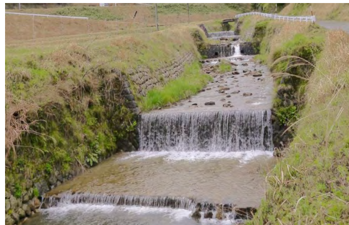
国登録記念物第1号となった 「雲原砂防施設群」