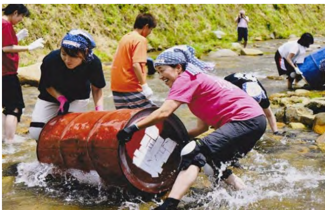
世界でひとつの 「ドラム缶転がしタイムレース」