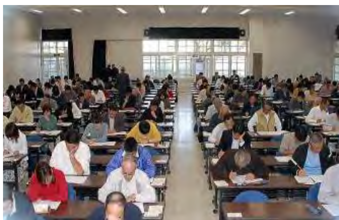
2007年に「京おとくに観光文化検定」を実施。