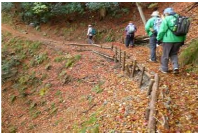
紅葉で落ち葉道となった「西山古道」

西山古道の整備やハイキングマップの作成、平和の桜「陽光桜」の植樹(400本以上)をしてきました。西山古道は10年間定期的に整備・補修を続けている。今では関西でも屈指のハイキング道として多くのハイカーに楽しまれたり、「京都西山連峰トレッキングマップ」は7000部を突破し、この地域の魅力PRに貢献している。