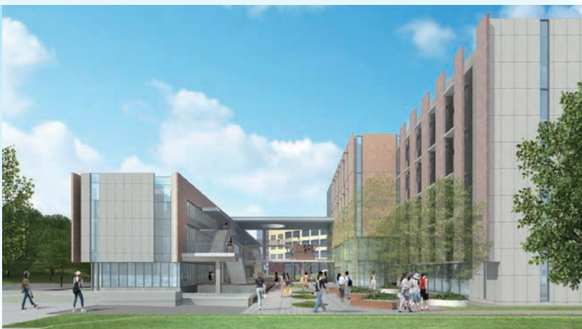
立命館大学びわこくさつキャンパス新棟トリシア 環境配慮型キャンパス想像の一環としてグリーンコンソーシアムを立ち上げ 関連する企業と共同で、省エネルギー、環境負荷軽減等、環境に寄与する 技術、設備、建築資材を導入し、それらの効果を継承しています。

講演会 「環境問題について考える」をテーマに、次世代の地球環境のため実際に取組まれている環境対策について一緒に考えてみましょう。