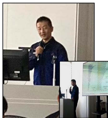
②労働災害発生状況と建設業の 安全衛生対策の推進について 奈良労働局 上林主任地方産業安全専門官