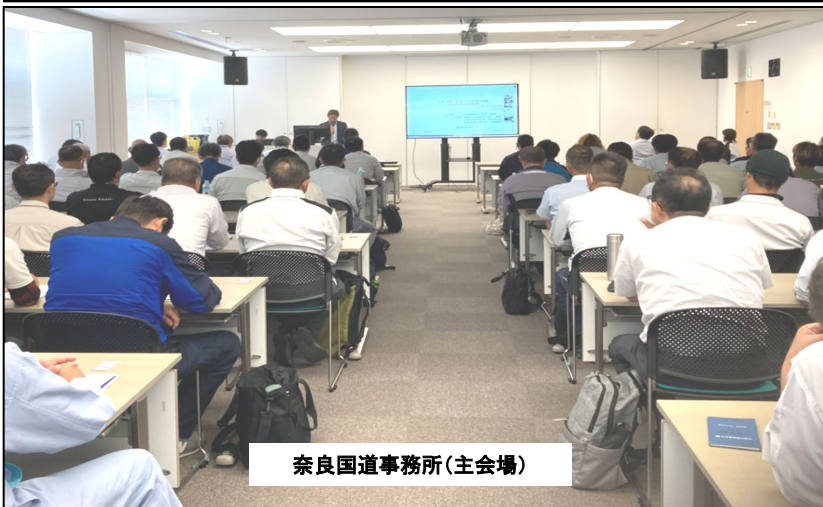
奈良国道事務所(主会場)

○工事事故防止や、工事の円滑化、建設業法に関する内容について継続的に受発注者間で協議することで、今後も建設現場等での安全・安心に取り組んで参ります。