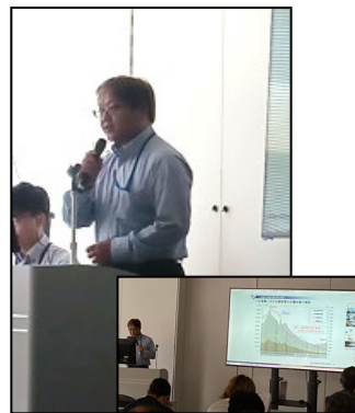
③近畿地方整備局管内における 工事等事故発生状況 近畿地方整備局 技術管理課 矢羽田課長補佐