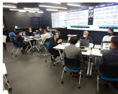
グループ討議 (アクティブラーニング)