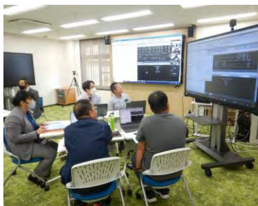
3D-CAD ソフトを用いた 演習