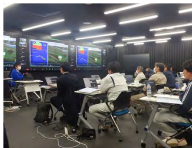
ICT 施工に関する講義