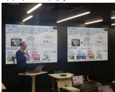
講義 : BIM/CIM 概論