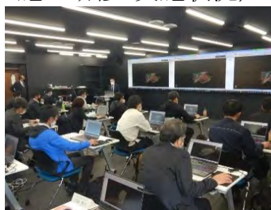
3D-CAD ソフトを用いた 実習