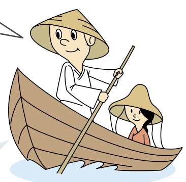
川舟で熊野川を下って参詣する人

熊野川は世界遺産「川の参詣道」として、古くから川舟の利用が盛んでした。古代・中世のころは、多くの人々がたし達のよう、本宮から新宮まで川舟で熊野川を下り、熊野速玉大社にお参りしていました。