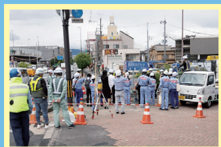
現地施工見学の様子