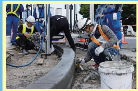
表面の凹凸を左官職人が整形