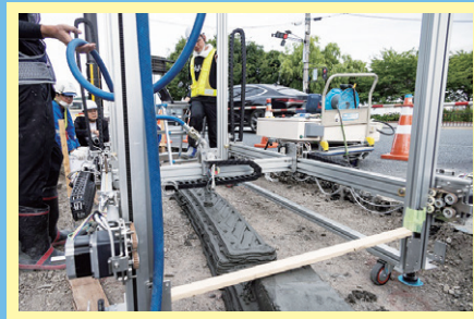
施工の状況 射出ノズルからモルタルが射出される