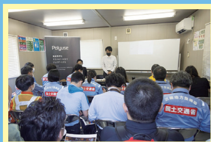
3Dプリンタの概要について説明

3Dプリンタの施工日に合わせて、発注者、NEXCO、自治体および学識経験者を対象に見学会を実施しました。現場事務所にて3Dプリンタの概要を説明したあと、現場で3Dプリンタによる打設の状況を見学しました。