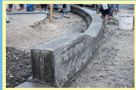
完成した縁石(3Dプリンタ部分)