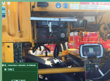
ICT施工機械（切削機）の使用