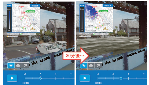
● 治水記念館2階から見る浸水状況

※2 LIDER：レーザー光を照射し、その反射光の情報をもとに対象物までの距離や対象物の形などを計測する技術