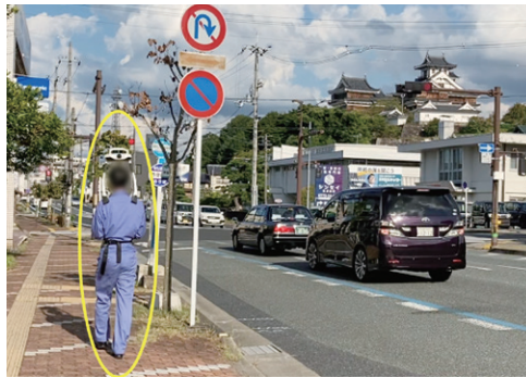
● 3次元点群データの計測状況