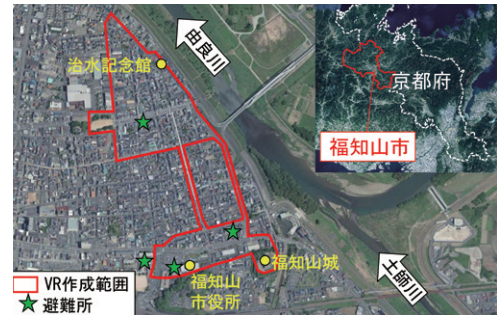
● 福知山市街地の約0.25 km 2 にて作成

体験者からは「実際の浸水速度が想定より早かったため、危機意識を持った」「初めて浸水の恐怖を実感した」との実際の水害体験に近く、感想を頂きました。