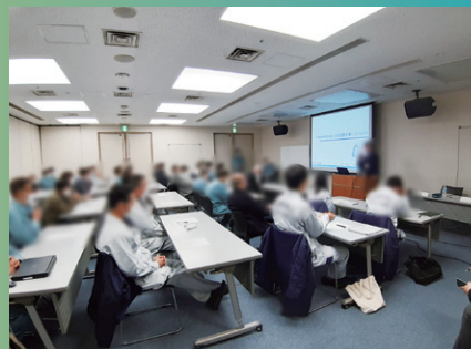
近畿地整 出前講座