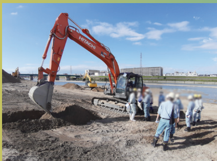
近畿地整 現場見学会