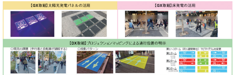
社会実験の実施場所及び内容

インフラDX・GXの導入の可能性の検証を目的として、DX技術であるプロジェクションマッピングを用いた通行位置の明示と日本初の取り組みとして、GX技術である床発電や太陽光発電を公道上に初めて設置しました。