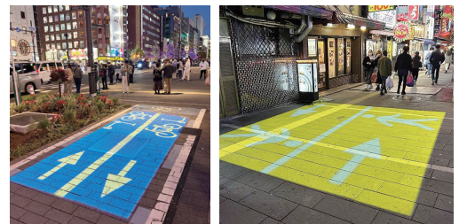
プロジェクションマッピングの投影状況

実験の結果、プロジェクションマッピングを見た人の約半数が、行動変容を行ったことが確認でき、課題解決に向けての効果が確認できました。