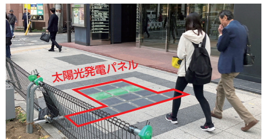
太陽光発電パネルの設置状況

今後は、十分な発電量を確保するために、周辺に建物が立地していない箇所に設置する等、日照時間を考慮した設置箇所の選定を行う必要があります。