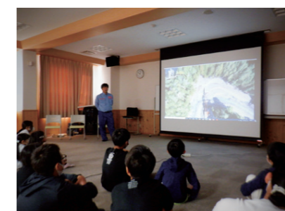
10/3成川小学校(紀宝町)

新宮地域のインフラDXに関する認知度向上、および、建設業界の担い手確保に寄与するため、小中学校の学生を対象とした出前授業を実施し、一定の理解と興味を持ってもらいました。