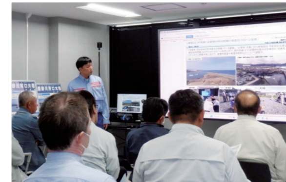
インフラDX概要・出張所取組の説明状況