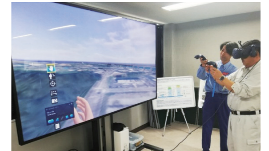
新宮道路VR体験状況

日時：令和5年10月18日(水) 13時30分～15時00分 場所：新宮河川国道維持出張所 (新宮インフラDX推進センター) 参加者：新宮地方建設業協同組合12名