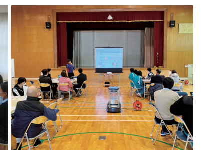
12/6熊野川中学校(新宮市)

新宮地域におけるインフラDX広報の取り組み 紀南河川国道事務所(新宮インフラDX推進センター)