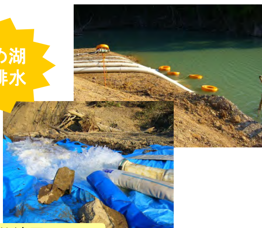
奈良県五條市 赤谷地区