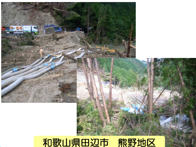
和歌山県田辺市 熊野地区