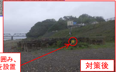
ロープ柵で周囲を囲み、 注意喚起の看板を設置