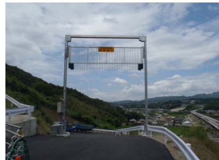
電動ゲート(ゲート上昇時)