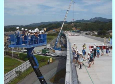
▲高所作業車の乗車体験