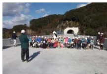
▲『魅せる！現場』見学会 (撮影:H26.1.11)

国土交通省近畿地方整備局では、『魅せる！現場』と称し現場見学の募集を行っており、紀勢線(田辺～すさみ)・那智勝浦道路も見学を受け付けています。