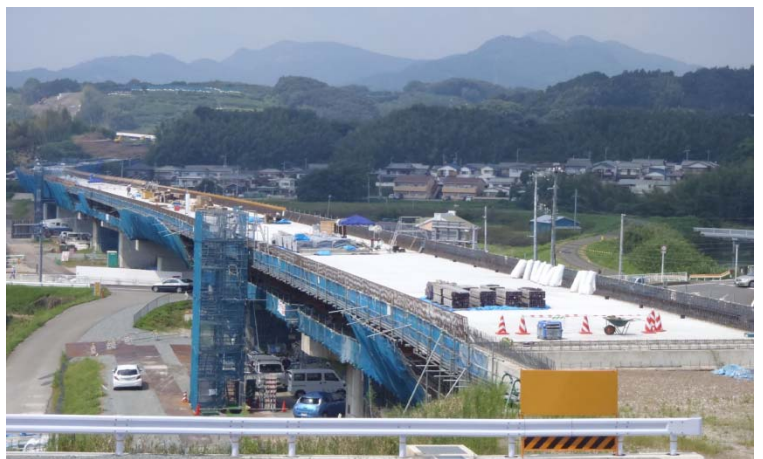
上万呂高架橋(8月撮影) 全長209m 鋼5径間連続合成少数板桁橋