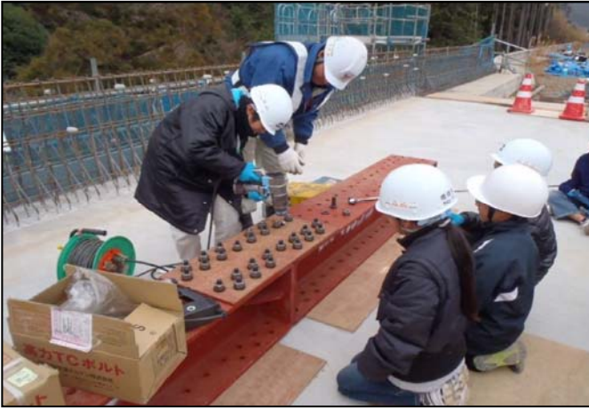
①高力ボルト締め付け体験

高力ボルト締め付け体験では、児童各自に締め付け機械でボルトを締める作業を体験してもらいます。