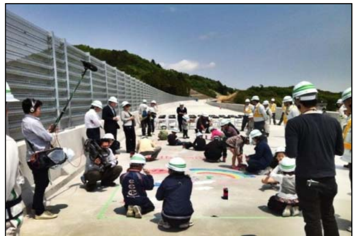
橋面メモリアルお絵かき

クレーン車は橋の建設では最もポピュラーな建設機械です。クレーンを上手に動かすために作業員がどのように指示を行っているのか、無線を使って、クレーンオペレータに指示をだしてもらい、誘導を行っていただきます。