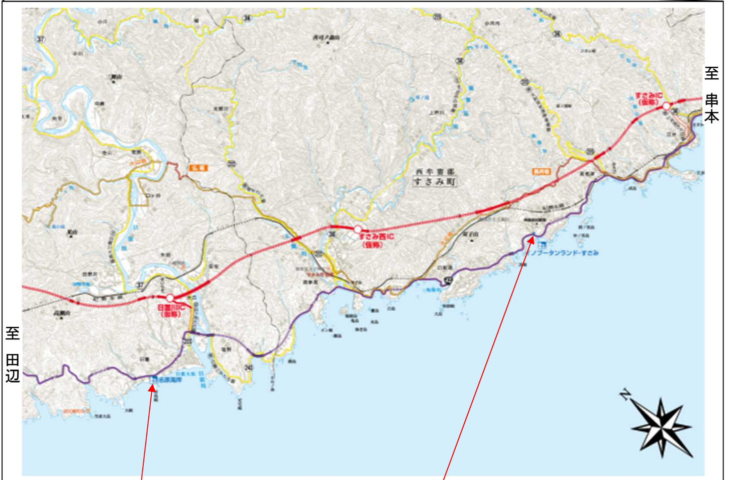
展示会場① 道の駅「志原海岸」