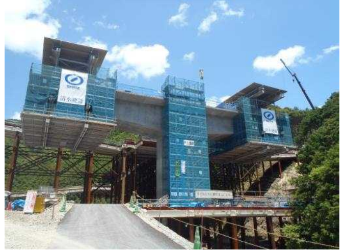
「張出施工中の和深川第二橋」 近畿自動車道紀勢線和深川第二橋上部工事 清水建設株式会社