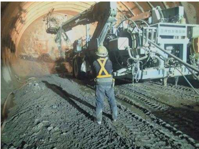
「トンネルを掘る人 坑夫」 近畿自動車道紀勢線見老津第二トンネル工事 三井住友建設株式会社