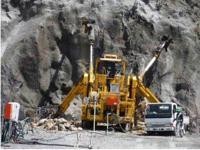
「ジャンボ！」 那智勝浦道路市屋第一トンネル工事 株式会社フジタ