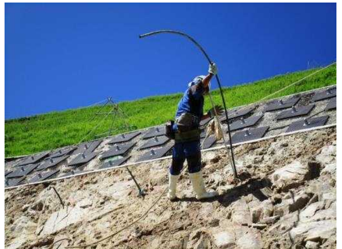
「山を制す」 近畿自動車道紀勢線と和深川地区改良工事 佐藤工業株式会社