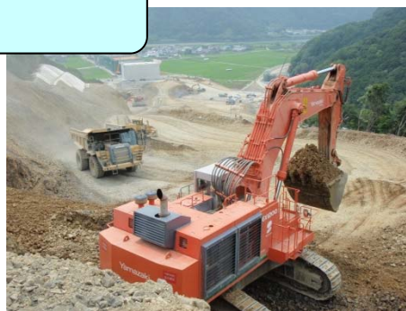
5m 3 バックホウ