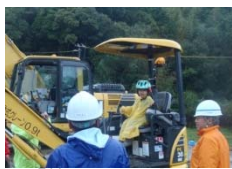
▲『魅せる！現場』見学会 (撮影：H25.10.15)

国土交通省近畿地方整備局では、『魅せる！現場』と称し現場見学の募集を行っており、紀勢線(田辺～すさみ)・那智勝浦道路も見学を受け付けています。