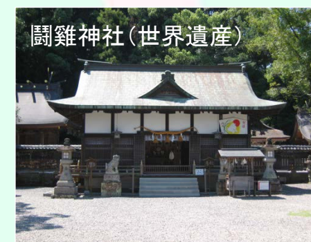
闘雞神社(世界遺産)

※「やにこう」は「とても、ものすごく」 「いいで」は「いいところ」意味する和歌山の方言です