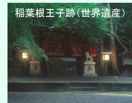
稲葉根王子跡(世界遺産)