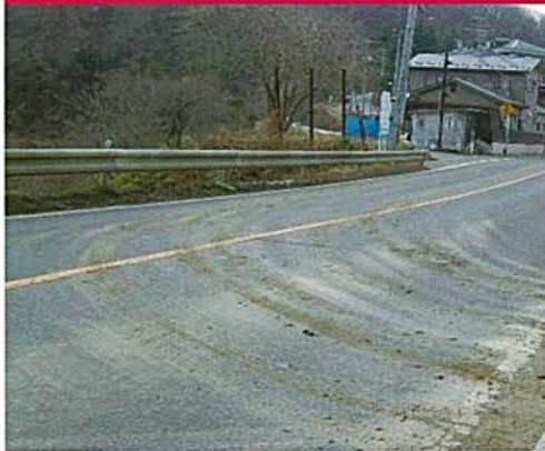
路面の汚れ(油・土砂)