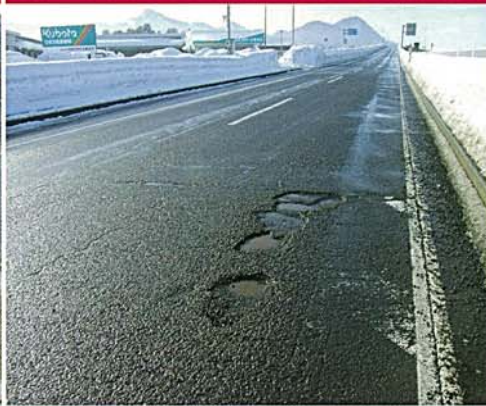
路面の穴ぼこ・段差