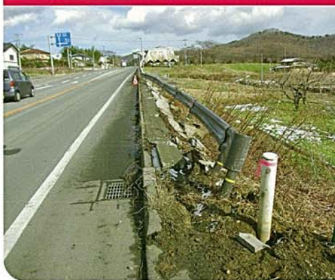
ガードレール・標識等の損傷