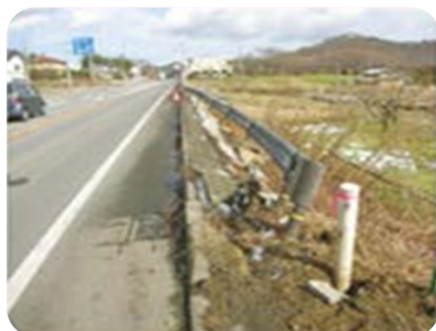
ガードレール・ 標識等の損傷