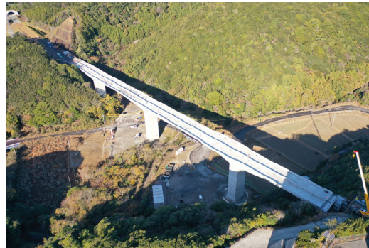
⑦串本町蘭野川(蘭野川橋)