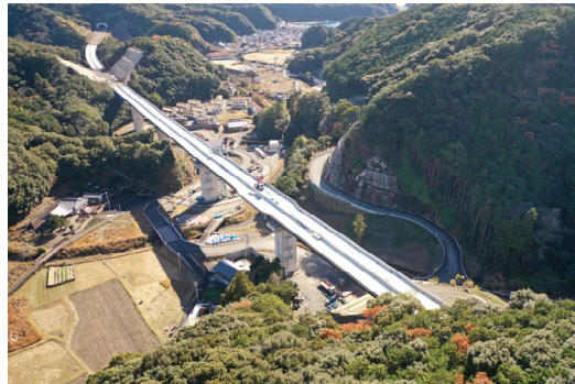
⑥串本町有田(有田川橋)