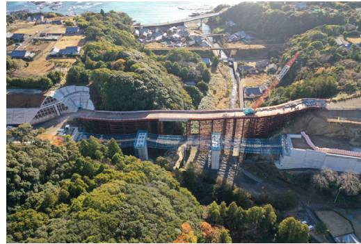
③串本町和深(安指川橋)