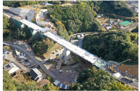
④串本町田子(田子川橋)