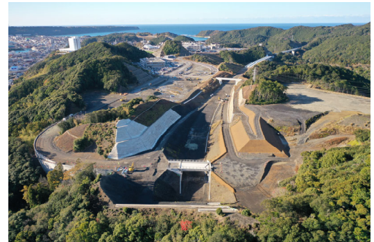
⑧串本IC仮称 (道路改良)