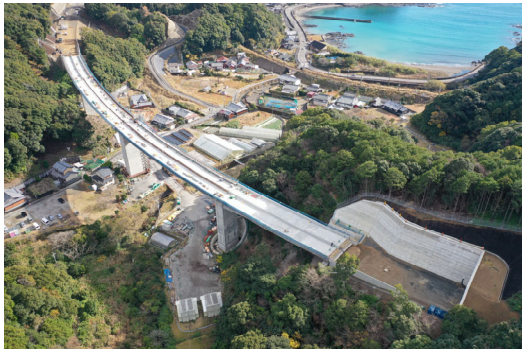
⑤串本町江田(江田川橋)