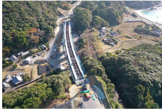
②すさみ町里野(小河瀬谷川橋)