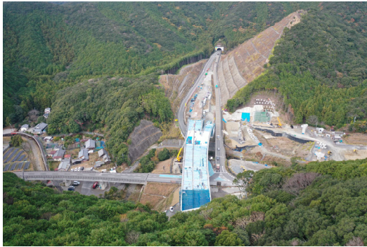
①すさみ町江住(江住川橋)