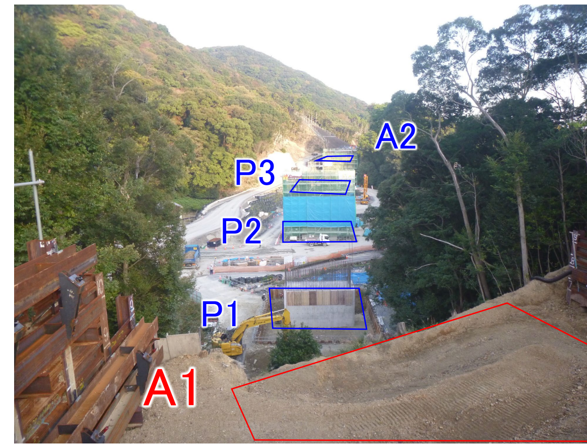
③ すさみ町里野(小河瀬谷川橋)