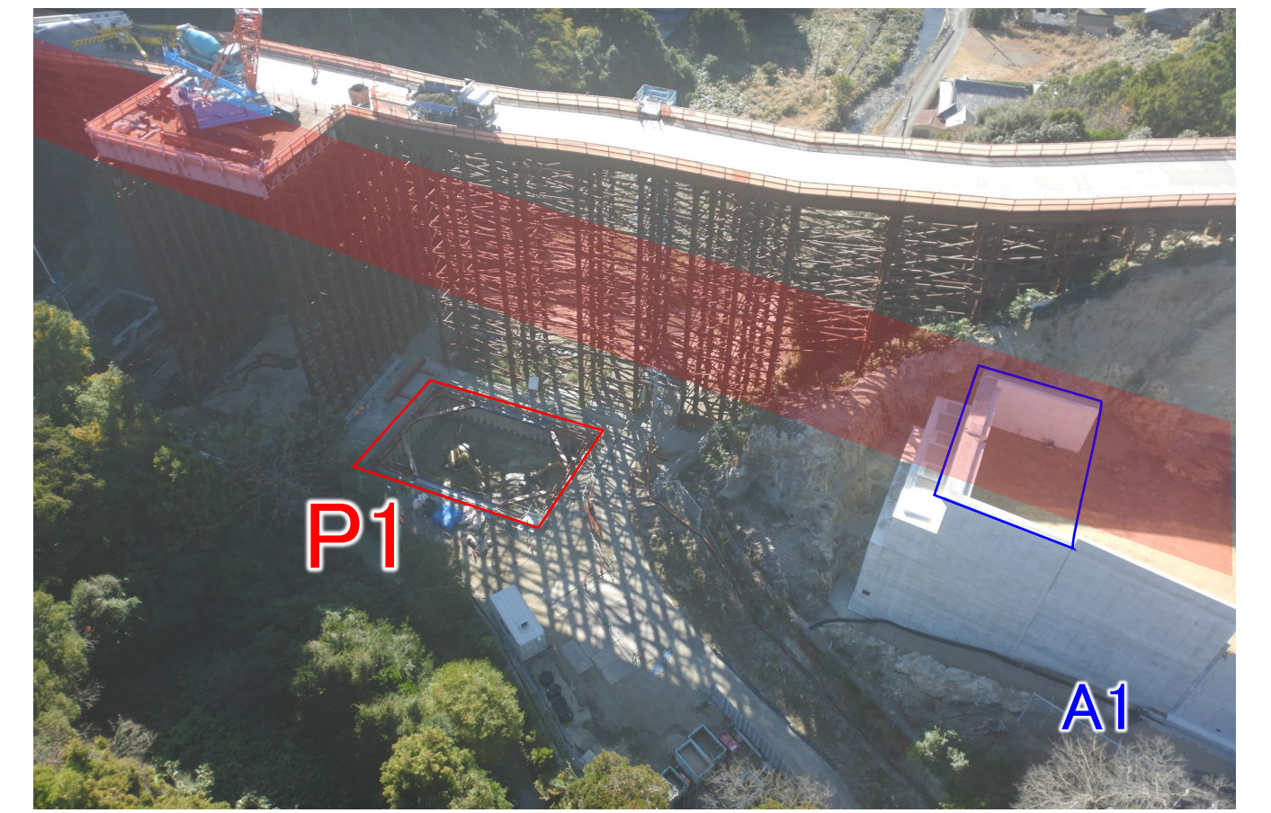
④串本町和深(安指川橋)