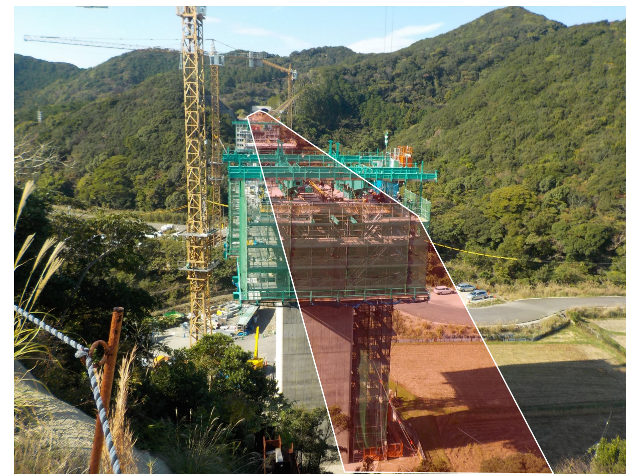
⑦串本町關野川(關野川橋)