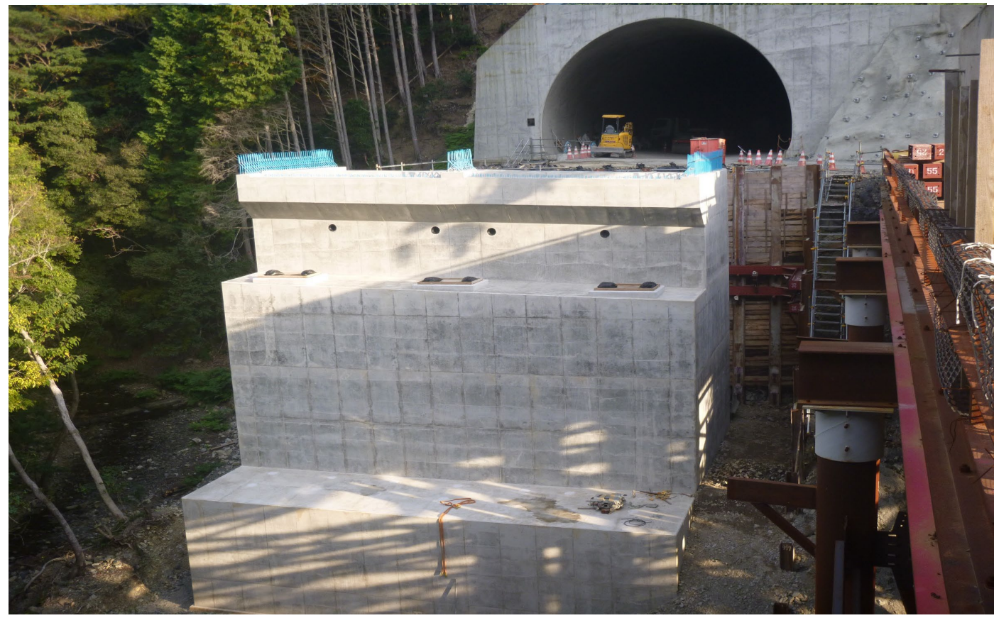
①すさみ町江住(小河谷川橋)