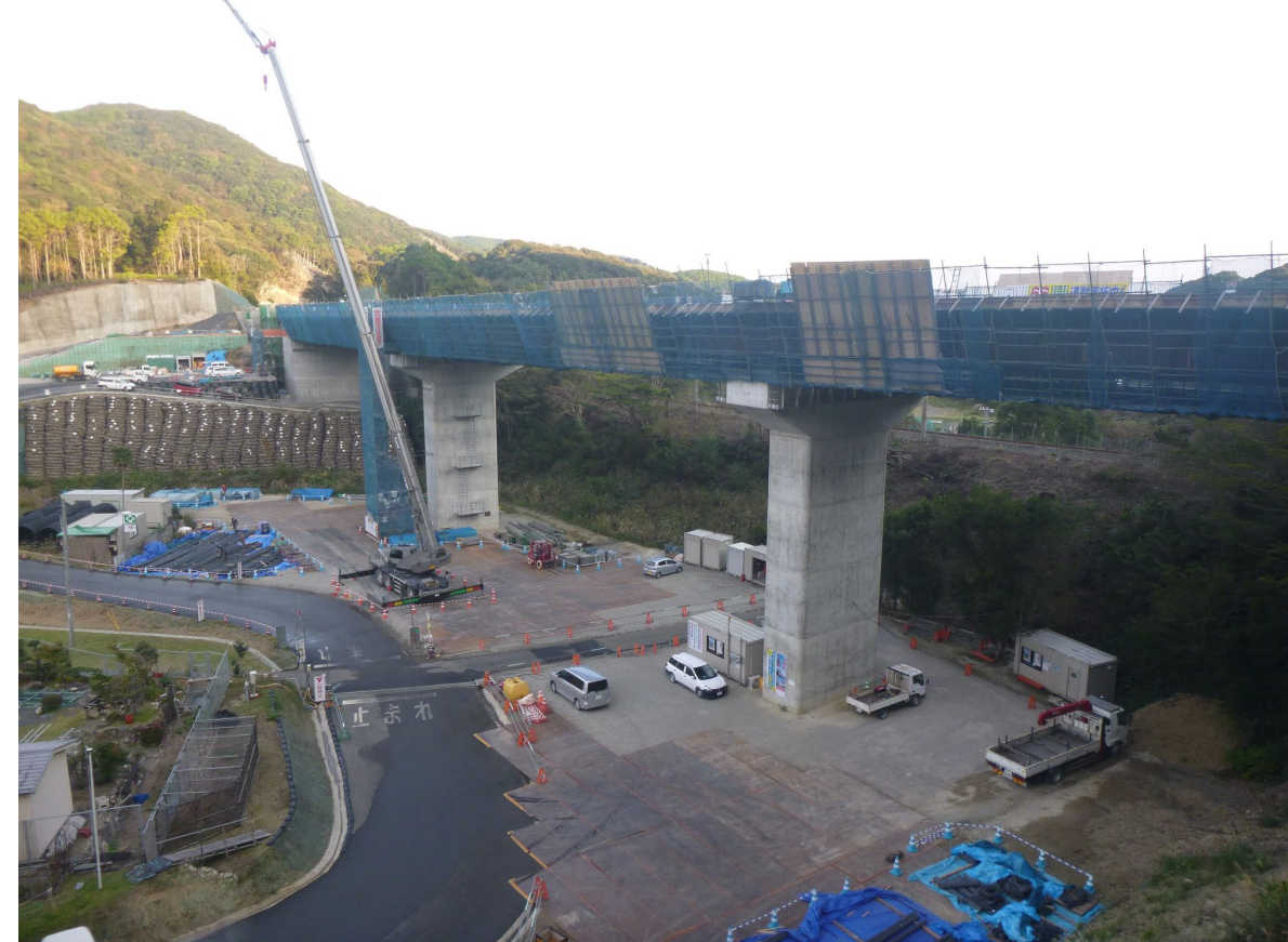
②すさみ町里野(里野西池川橋)