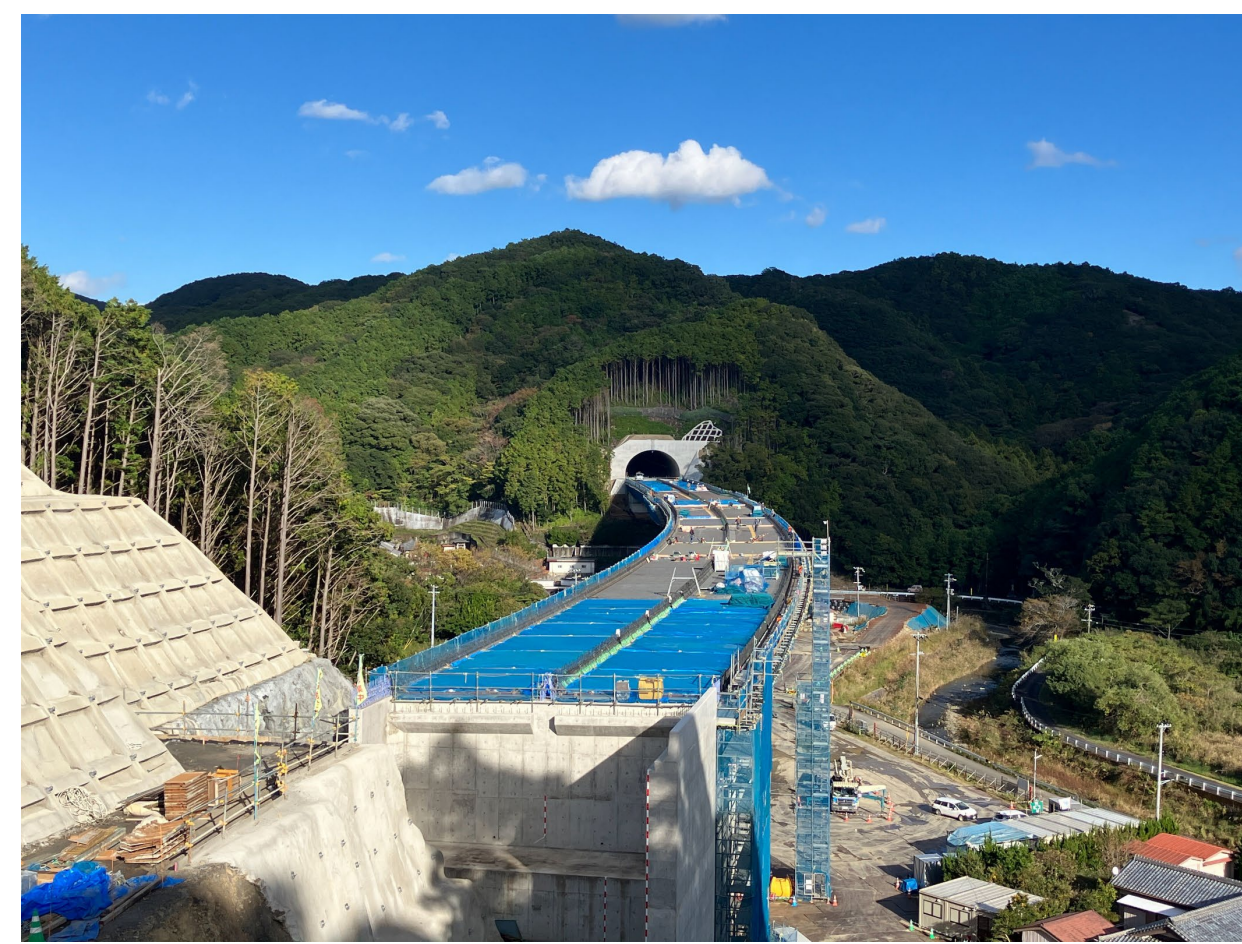
⑥ 串本町田並(田並川橋)