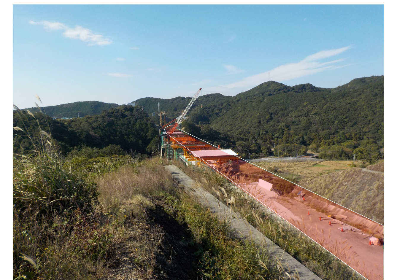
⑧串本町サンゴ台(サンゴ台高架橋)