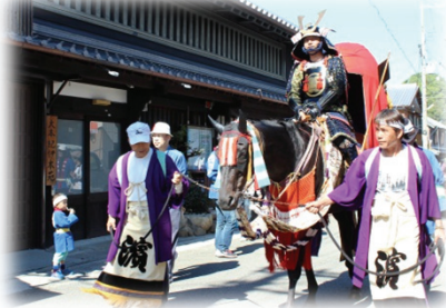
湯浅町【顯國神社祭礼】