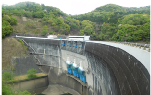
天ヶ瀬ダムの天端状況