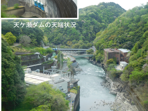
天ヶ瀬ダムの天端から下流側の状況