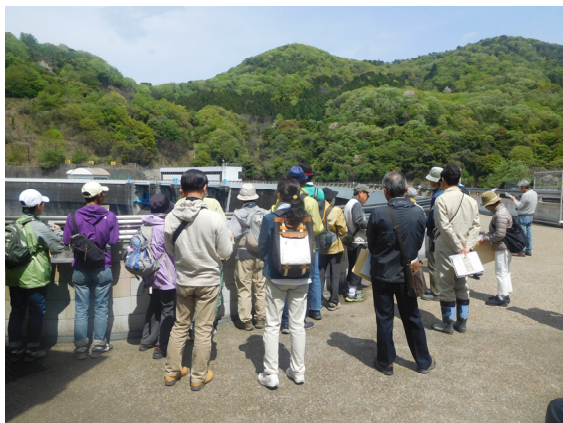
天ヶ瀬ダムの天端より天ヶ瀬ダム再開発事業の概要説明をしています