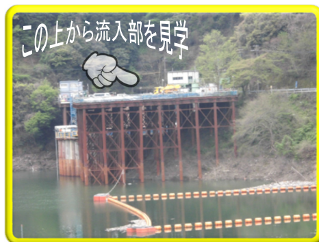
流入部を対岸から遠景