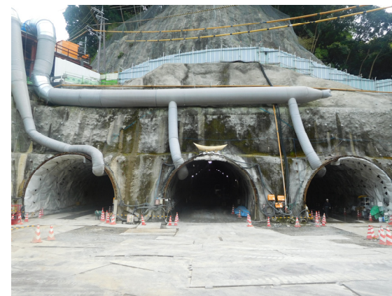
減勢池部トンネル入口付近の状況