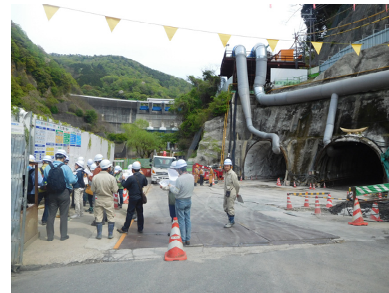
減勢池部トンネル入口付近にて現在の施工状況の説明をしています