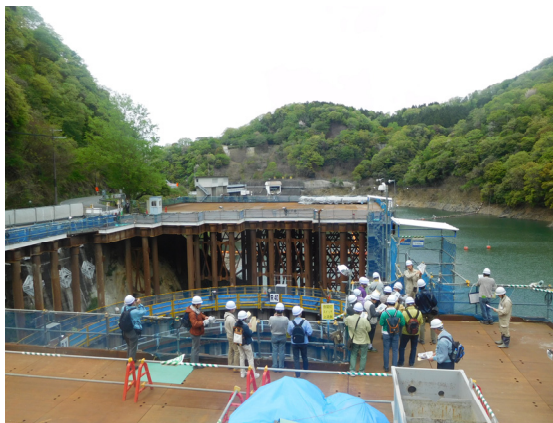
栈橋と呼ばれる仮設のステージ上から現在の施工状況の説明をしています