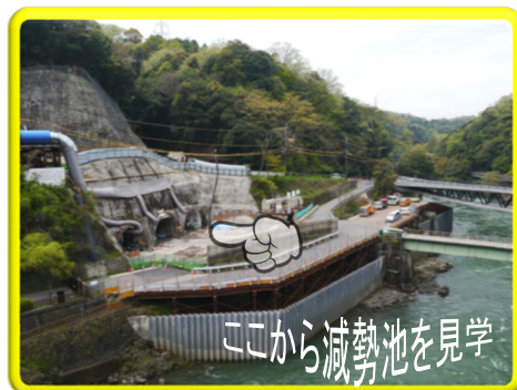
減勢池部を対岸から遠景