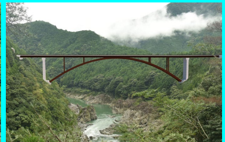
< 3号橋完成予想図 >