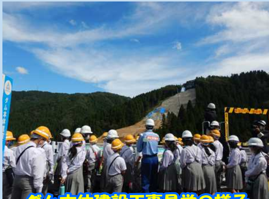
ダム本体建設工事見学の様子