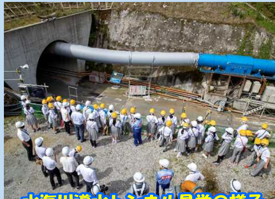
水海川導水トンネル見学の様子